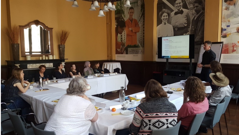
Foto eerste training, onderdeel