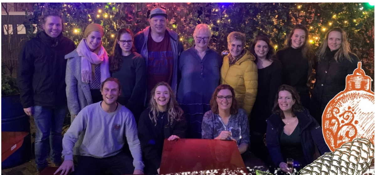
Foto kerstviering 2019